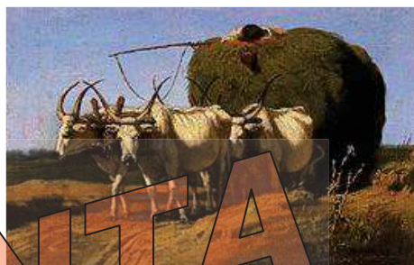
Lotz Károly: Őkrös szekér

A Feszty-körkép egy részlete: Árpád fejedelem és vezérei.