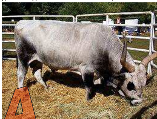
Kormos magyar szürke bika

testméretű képviselője. A 13–18. század között Közép-Európa legkiválóbb hústermelője volt, állománya átvészelt súlyos történelmi időköt, és évszázadokon keresztül jelentős szerepet játszott a magyar gazdaság egészében. Néhány elkötelezett szakembernek köszönhetően sikerült a fajtát megőrizni és ma már az állomány létszáma emelkedik,