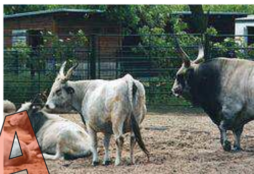
Bika, tehén és növendék borjú

A magyar kormány 2008 őszén kezdeményezte az Európai Bizottságnál a „magyar szürkemarha hús” oltalom alatt álló földrajzi jelzésként (OFJ) történő nyilvántartásba vételét, amely a 2011. december 9-i 1300/2011/EU bizottság végrehajtási rendelettel megvalósult.